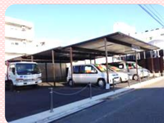
店から歩いてすぐの所です